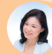
こうのとりのフォーラム運営委員長 ラ・シゴニーユ編集長