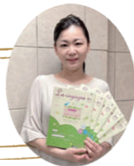
ラ・シゴニュー編集長

ラ・シゴニュー編集長がオススメする 「赤ちゃんを授かりたいと願う方々に読んでほしい書籍」